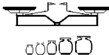
Рис. 16.6. Терези з важелями

9. Намалюйте терези з важелями (рис. 16.6). Важелі створіть за допомогою інструмента збільшення. Скільки разів ви застосовували копіювання та симетричне відображення?