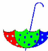
в) вертикальне відображення