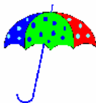
б) горизонтальне відображення